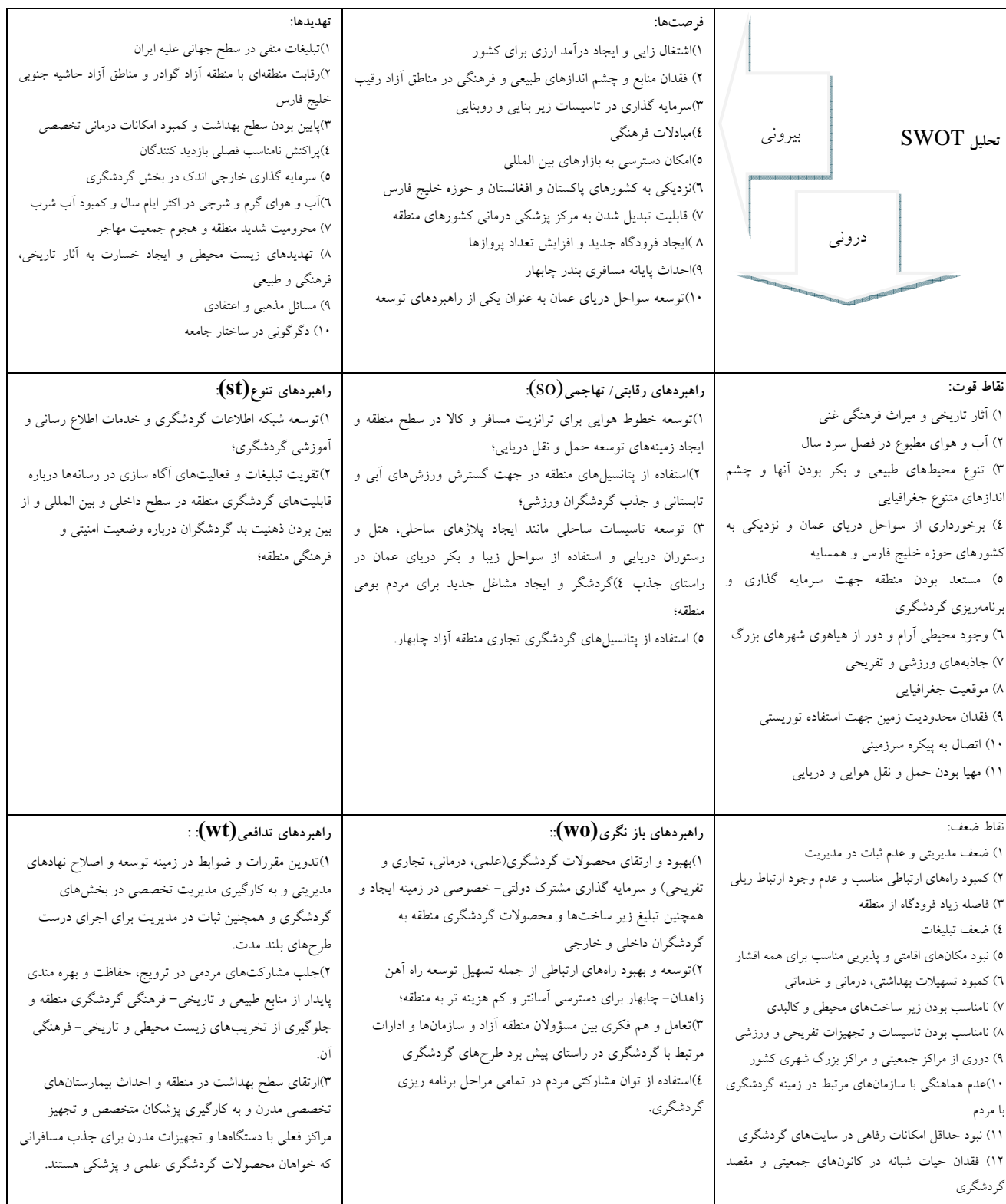
جدول شماره ۶- ماتریس راهبردها و راهکارهای توسعه گردشگری در چابهار