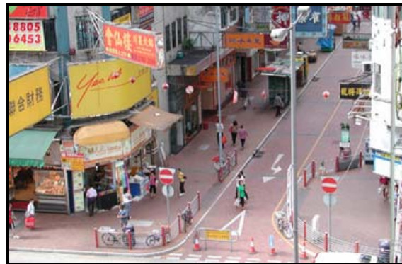
شکل شماره ۱- مقایسه تطبیقی خیابانی در هنگ‌کنگ قبل و بعد از تبدیل شدن به محور پیاده