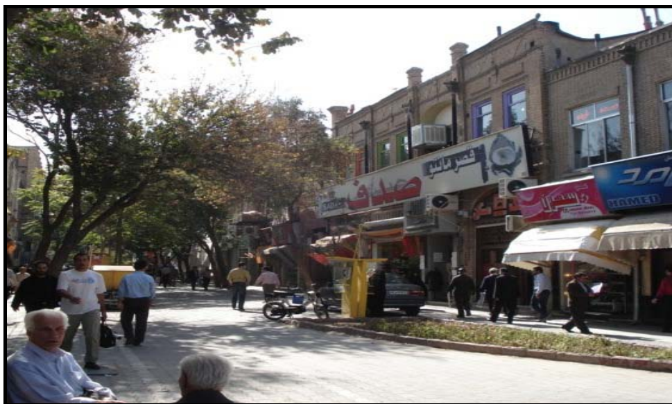
شکل شماره ۵- پیاده راه تربیت عرصه‌ای برای حضور شهروندان

در طول مسیر کنترل می‌شود. بنابراین، افراد پیاده‌ای که به این محل می‌آیند، امکان حرکت بدون مانع، آسایش، امنیت و آزادی برقراری ارتباط با شهروندان را پیدا می‌کنند. طبق نظر گهل (۱۹۸۷)، بهترین مکانهای عمومی، فضاهایی هستند که فعالیتهای اختیاری و اجتماعی را به صورت موفقیت‌آمیزی