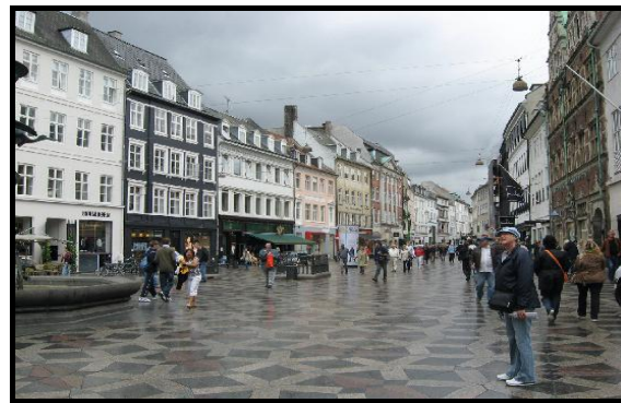
شکل شماره ۲- پیاده‌راه عرصه‌ای برای حضور شهروندان (کپنهاگ - دانمارک)