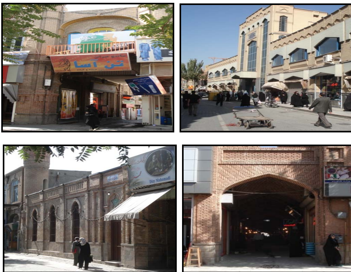
شکل شماره ۴-تصاویری از بدنه‌سازی و معماری با ارزش خیابان تربیت

استقرار و حضور را در محل تقویت نموده و موجبات رونق فعالیت‌هایی، نظیر: اغذیه‌فروشی، کافی‌شاپ و کاربریهایی از این دست را فراهم ساخته است، اما فعالیت کاربریهایی نظیر صنف مبل‌فروشان و مشکلات بارگیری و باراندازی آنها، از جمله مشکلاتی است که معلول وجود کاربریهای ناهمخوان و ناسازگار در این محور است.