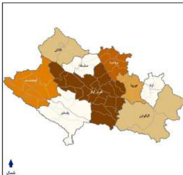
شکل ۱- نقشه موقعیت جغرافیایی استان لرستان به تفکیک شهرستان

رشته کوه‌های زاگرس قرار دارد. استان لرستان از شمال به همدان، از شمال شرقی به استان مرکزی، از شرق به استان اصفهان، از جنوب به استان خوزستان، از غرب به استان لرستان و از شمال غربی به استان کرمانشاه محدود است. بر اساس آخرین تقسیمات کشوری و استانی در سال ۱۳۸۵ این استان شامل ۹ شهرستان، ۲۳ شهر، ۲۶ بخش و ۸۳ دهستان بوده است.