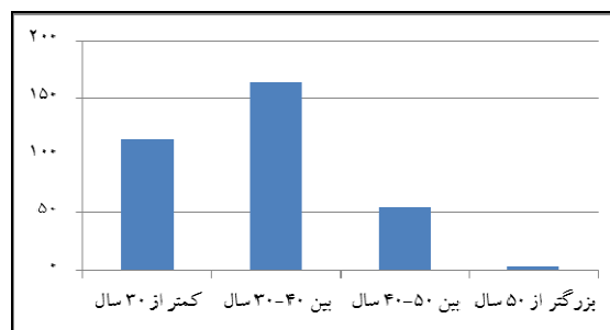
شکل ۲ فراوانی توزیع پاسخ دهندگان براساس سن

نتایج تحلیل عاملی مقیاس مورد استفاده در جدول ۳ ارائه شده است. بار عاملی مشاهده شده در تمامی موارد مقداری بزرگتر از 0/3 دارد که نشان می‌دهد همبستگی بین متغیرهای پنهان (ابعاد هر یک از سازه‌های اصلی) با متغیرهای قابل مشاهده قابل قبول است. پس شناسایی همبستگی متغیرها، آزمون معنی داری صورت گرفت. جهت بررسی معنی دار بودن رابطه بین متغیرها از آزمون تی (T-test) استفاده گردید. چون معنی داری در سطح خطای 0/05 بررسی می‌شود بنابراین اگر میزان بارهای عاملی مشاهده شده با آزمون t-value از 1/96 کوچکتر محاسبه شود، رابطه معنی دار نیست. براساس نتایج مندرج در جدول ۴ شاخص‌های سنجش هر یک از مقیاس‌های مورد استفاده در سطح اطمینان 0/5 مقدار آماره t-value بزرگتر از 1/96 است که نشان می‌دهد همبستگی‌های مشاهده شده معنی دار هستند.