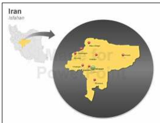
شکل ۲: موقعیت جغرافیایی شهر اصفهان در گستره جغرافیایی ایران

از نظر تقسیمات کشوری شهر اصفهان مرکز استان اصفهان است که در فاصله ۲۵ کیلومتری جنوب تهران واقع شده است. منطقه‌ای که شهر اصفهان در آن قرار دارد یکی از حاصلخیزترین جلگه‌های ایران می‌باشد. اصفهان در مرکز فلات ایران قرار دارد که از یک سو به ارتفاعات برف‌گیر و از سوی دیگر به جلگه‌های حاصلخیز منتهی می‌شود که موقعیت خاصی برای این استان فراهم کرده است. موقعیت ویژه و تنوع آب و هوای استان از زمان‌های باستان تاکنون آن را محل استقرار گروه‌های بزرگ انسانی و مرکز ثقل تمدن‌های کهن و شکوفایی اقتصاد و فرهنگ ایران قرار داده است. به همین علت استان صنعتی-کشاورزی اصفهان مناسبترین نقطه جهت استقرار صنایع سنگین از جمله ذوب آهن تشخیص داده شده است. شهر اصفهان در مسیر تلاقی راه‌های شمالی و جنوبی ایران واقع شده است. از این رو دارای موقعیت ممتازی است. اصفهان، از نظر جغرافیایی جزء منطقه مرکزی و خشک است.