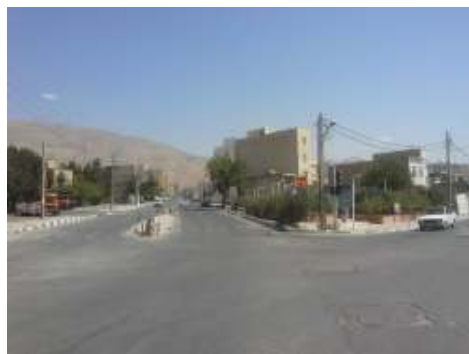
تقاطع خیابان امام حسین (ع) و خیابان ولیعصر (عج)

این گره در اولویت ایجاد مرکز محله به عنوان فضای همگانی امن قرار می‌گیرد (شکل ۳).