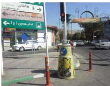
تقاطع خیابان امام حسین (ع) و خیابان وردآورد

از مکان یابی محدوده‌های ناامن (ذکر شده در بخش ۳-۲) نشان داد، عدم کیفیت نظارت در تقاطع خیابان امام حسین و خیابان ولیعصر، کاملاً مشهود است بنابراین،