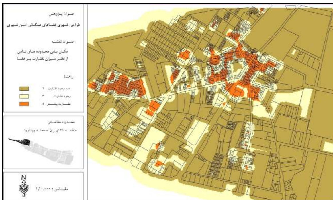
شکل ۱- نقشه ارزش‌گذاری میزان نظارت بر فضا بر اساس توزیع خدمات و کاربری‌ها

تحلیل شد؛ کاربری‌های موجود در محدوده مطالعاتی با عملکرد باغات، گلزار شهدا، کارگاه‌ها و کارخانجات، صنایع و محدوده نظامی و همچنین زمین‌های بایر و رها شده در بافت محله به عنوان کاربری‌های غیر فعال در شبانه روز و بدون نظارت بر فضاهای شهری به جهت نبود نفوذپذیری در بدنه و عدم جذب فعالیت اجتماعی، و کاربری‌های فعال تجاری با عملکرد مختلط و خرده‌فروشی‌ها که در تواتر زمانی به فضاهای شهری در محله نظارت دارند به صورت داده‌های مکانی در محیط نرم افزار اطلاعات جغرافیایی ارزش‌گذاری شدند و تحلیل نظارت بر فضا، به صورت نزدیکترین فاصله (Near Distance) از کاربری‌های فعال (با در نظر گرفتن شعاع دید به فضا) و کاربری‌های غیر فعال در شبانه روز، به منظور سنجش امنیت محیطی در فضاهای شهری اندازه‌گیری گردید. و از برآیند این نقشه‌ها، نقشه مکان‌یابی محدوده‌ها از منظر میزان نظارت بر