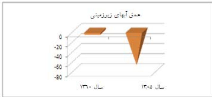
شکل شماره ۲- نمودار تغییر سطح آب زیرزمینی در فاصله سال‌های ۱۳۶۰-۱۳۸۵