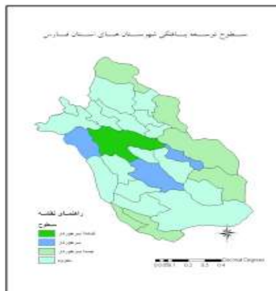
شکل ۲. نقشه سطوح توسعه یافتگی شهرستان‌های استان فارس

شهرستان شیراز بوده است. بنابراین شهرستان‌های نو پا که از سال ۱۳۸۵ به بعد مستقل شده اند، با وجود این که در مرکز استان واقع شده اند ولی جزء محروم‌ترین شهرستان‌ها هستند. بنابراین فرضیه اول تأیید می‌گردد و نابرابری در سطح استان مشهود است.